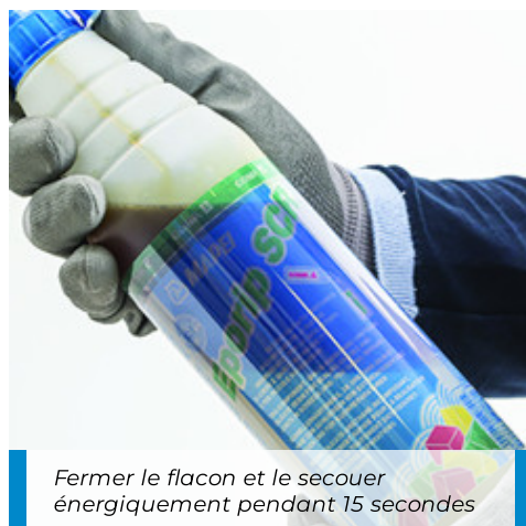
Fermer le flacon et le secouer énergiquement pendant 15 secondes