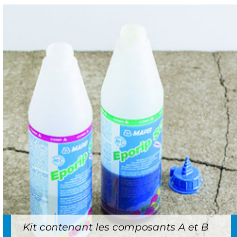
Kit contenant les composants A et B

Le mélange commence à réagir et à durcir directement après le mélange. La consistance au départ liquide se rafermit au fur et à mesure. Les fissures fines peuvent être comblées directement. Pour des joints larges, attendre environ 3 à 5 minutes et procéder rapidement à l'application pendant le temps ouvert qui est de 10 à 12 minutes environ. Pour les passes suivantes ou le collage, Eporip SCR encore frais doit être sablé à l'aide de Quarzo 1,2 .