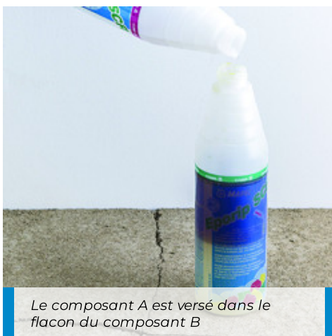
Le composant A est versé dans le flacon du composant B