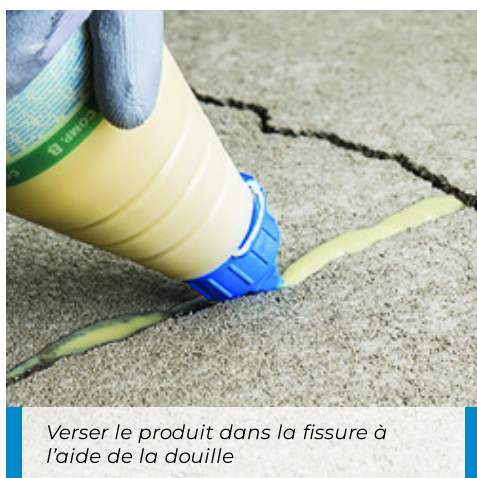
Verser le produit dans la fissure à l'aide de la douille