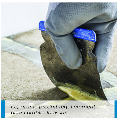
Répartir le produit régulièrement pour combler la fissure